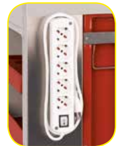
K617311 Complesso di 5 prese più cavo di collegamento.