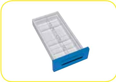
K617326 Divisorio a pettine a 8 scomparti per cassetti lung. 300 mm.