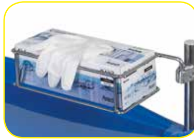
K817045 Supporto contenitore guanti monouso.