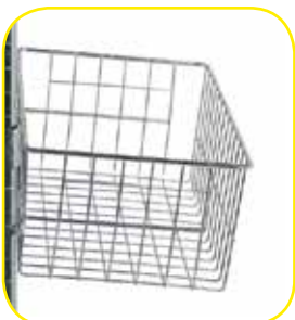
K617429 Cestello grande in filo di acciaio cromato. Dim. 390x250x155 h mm.