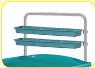
K617470V Sopralzo a due vaschette per carrelli standard .