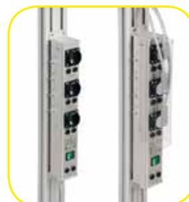
K618457 Multipresa elettrica tipo MED a 3 uscite con nodo equipotenziale