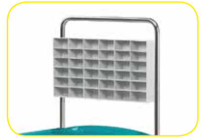
K617454 Sopralzo porta fili di sutura a 36 vani per carrelli standard .