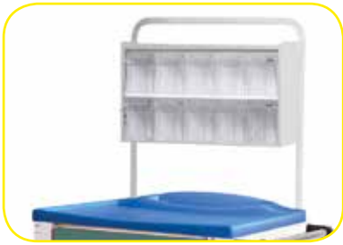
K617450V Sopralzo con cassettera reclinabile per carrelli standard .