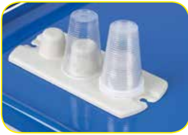
K617422 Portabicchieri a piano a tre torrette.