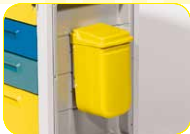
K617013 Portarifiuti con apertura a ginocchio da 10 litri.