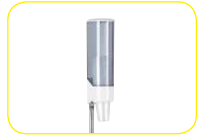
K617423 Portabicchieri a torretta.