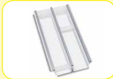
K617329 Divisorio regolabile per cassetto lung. 300 mm.