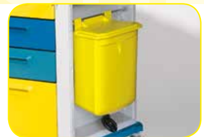
K617015 Porta rifiuti con apertura a pedale da 15 litri circa.