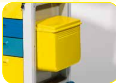
K617014 Portarifiuti con apertura a ginocchio da 20 litri.