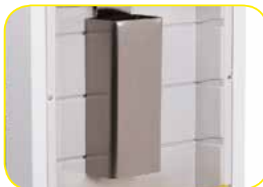
K617353X Porta cateteri o sonde in acciaio inox. Dim. 130x75x390 h mm.