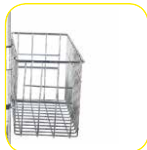
K617430 Cestello piccolo in filo di acciaio cromato. Dim. 390x130x150 h mm.