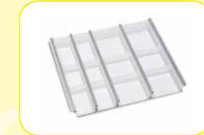
K617327 Divisorio regolabile per cassetto lung. 600 mm.