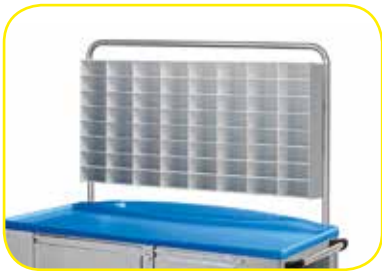
K617456 Sopralzo porta fili di sutura a 64 vani per carrelli medium .