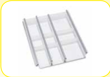
K617328 Divisorio regolabile per cassetto lung. 450 mm.