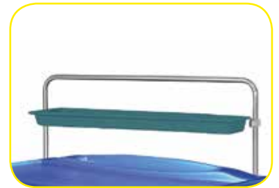
K617459 Sopralzo basso con vaschetta per carrelli medium .