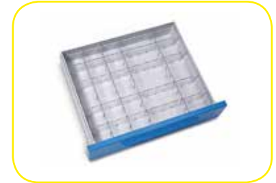
K617317 Divisorio a pettine a 25 scomparti per cassetti lung. 600 mm.