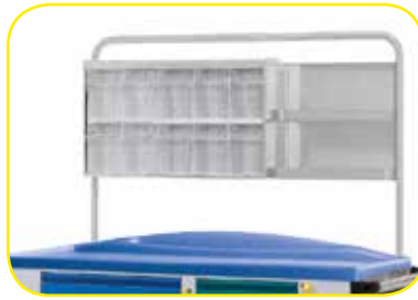
K617452V Sopralzo con cassettera reclinabile per carrelli medium .