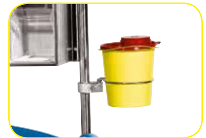
K617416 Supporto porta contenitori acuminati.