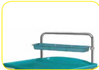
K617458 Sopralzo basso con vaschetta per carrelli standard .