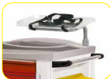
K617438 Piattaforma girevole porta monitor.