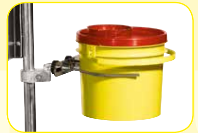
K617432 Supporto regolabile porta contenitori acuminati.