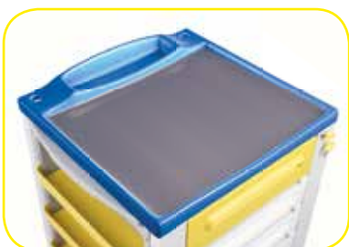
K617431 per carrelli small .