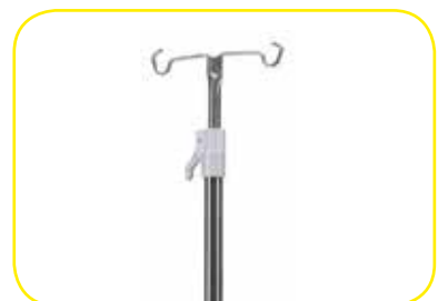
K617350 Asta flebo regolabile a due ganci.